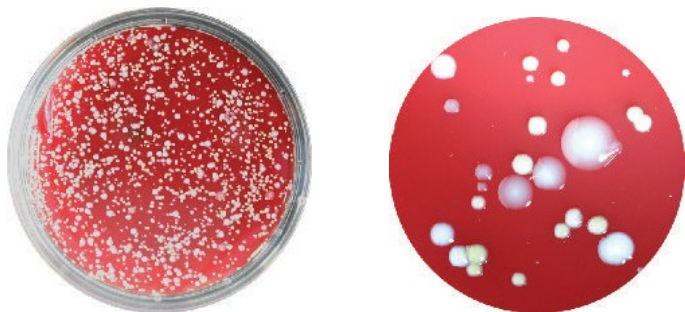
Abb. 2: Abklatsch einer Hautfläche mit einer medco Standard-Abklatschplatte (Blut-Agar). Links ganze Platte, rechts Detail.

Der chromogene ECC-Agar eignet sich zum Nachweis und zur Differenzierung von E.coli und Coliformen und ermöglicht somit eine schnelle, einfache und zuverlässige Prüfung auf fäkale Kontamination.