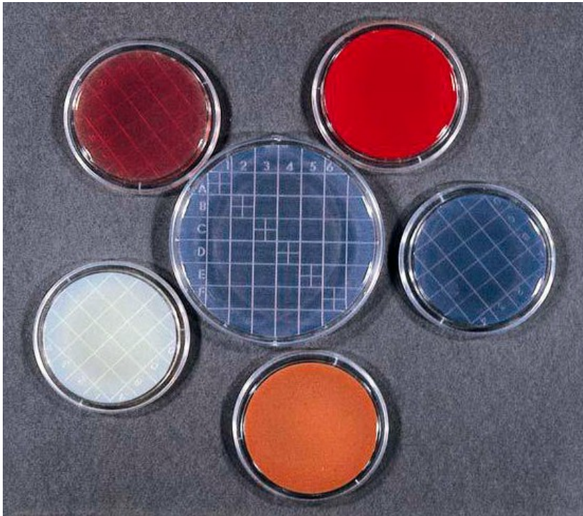
Abb. 1: medco Abklatschplatten „Maxi“ und „Standard“ (Ø 90 bzw. 55 mm)

Für die Hygienekontrolle im klinischen und industriellen Bereich, für Umgebungsanalysen und Untersuchungen in der Personalhygiene