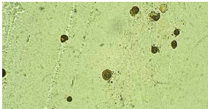
Abb. 2: Ureaplasma urealyticum bildet mikroskopisch kleine, igelförmige Kolonien.

Kolonien von Mycoplasma hominis lassen sich anhand der sehr typischen „Spiegeleiform“ nachweisen (Abb. 3).